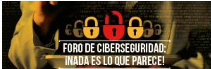
Foto de ciberseguridad: ¡NADA ES LO QUE PARECE! Bogotá 5 de septiembre